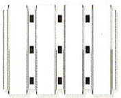
fessurazione tipo 1